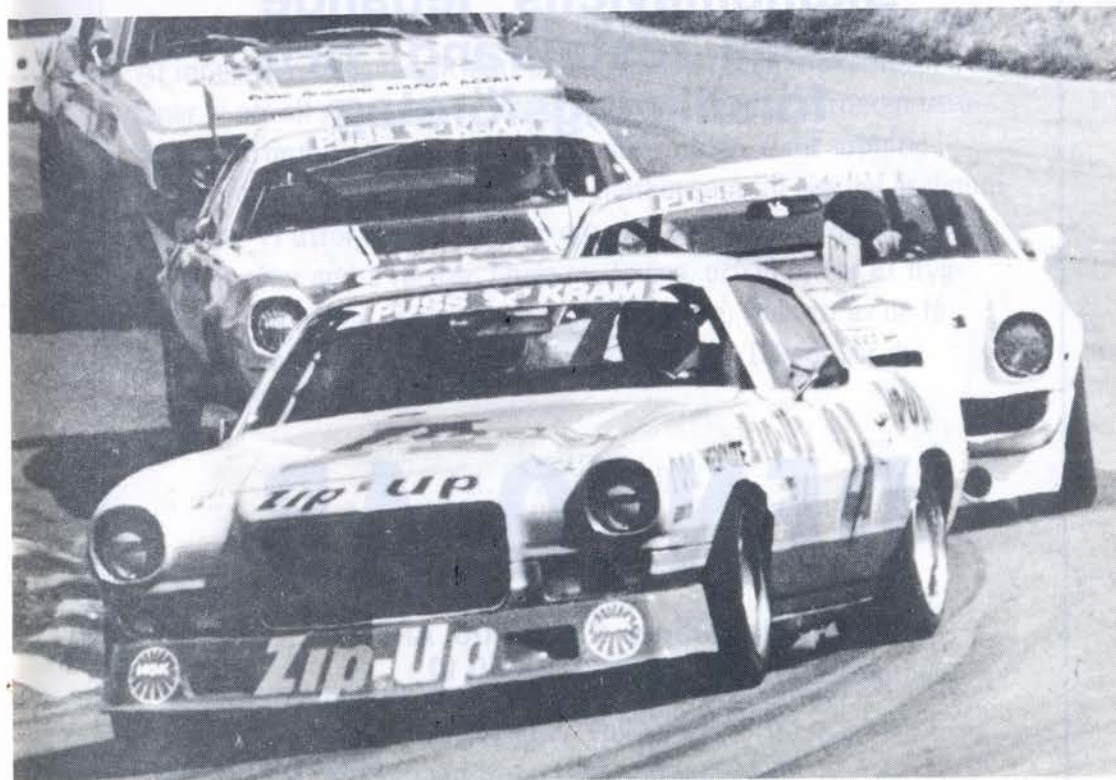
Rallycross fast på racerbanan blir det i Kvällsposten News Race den 4-5 september. Då kommer Puss o Kram Super Star Cup med de stora amerikanska V8:a bilarna till Knutstorp.